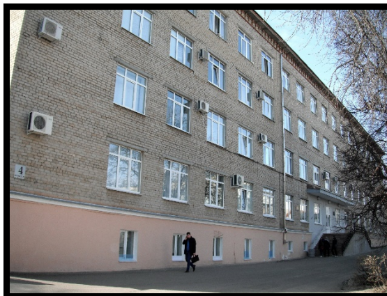
ПГУ, учебный корпус № 4

Подготовительные курсы ПГУ (корпус № 8, ауд. 8-207, тел. (8-841-2) 20-84-15) дают возможность получить повышенные баллы по ЕГЭ и поступить в университет Сайт: https://iito.pnzgu.ru/dov